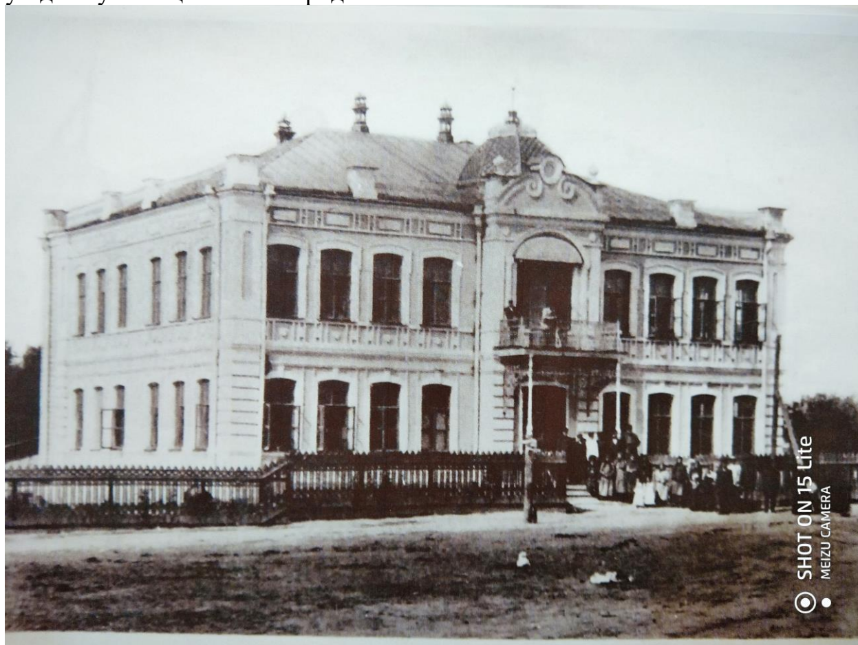
Томаровское образцовое двухклассное Министерства Народного Просвещения училище, фото начала 20 века.

История Томаровской средней школы № 1 берет свое начало с Томаровского образцового двухклассного Министерства Народного Просвещения училища, открытого в 1899-1900 гг. и располагавшегося в прекрасном двухэтажном каменном здании, построенном на средства крестьян 2-го Томаровского общества, которые выкупили десятину земли за 1000 рублей и построили здание училища за 20 тысяч рублей. По ходатайству жителей училище получило наименование Николаевское (в честь коронации царя Николая II). Находилось на месте современной Пожарной части поселка Томаровка. К началу 20 века в Томаровке уже работали Белянская и Кисловская земские школы, но Белгородская уездная управа сообщала, что «население слободы Томаровки в массовом своем развитии стоит гораздо выше населения прочих сельских местностей Белгородского уезда, почему уже и назрела потребность в школе с большей образовательной программой». Школьный курс в Томаровском образцовом двухклассном училище изучался в течении пяти лет и окончившие его имели равные права с окончившими уездное училище в г. Белгороде.