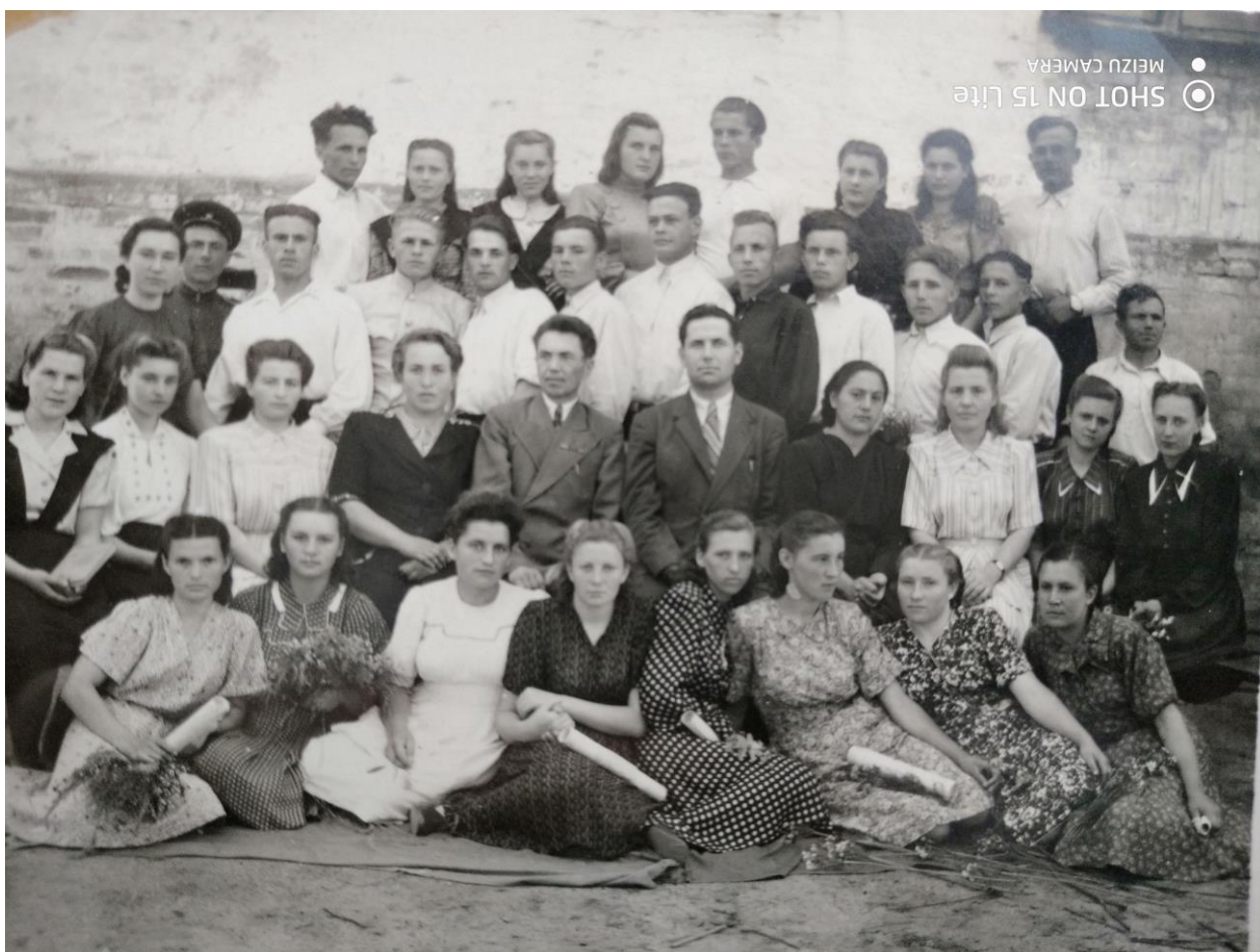
Выпускной 10 класс Томаровской средней школы, 1950 год.