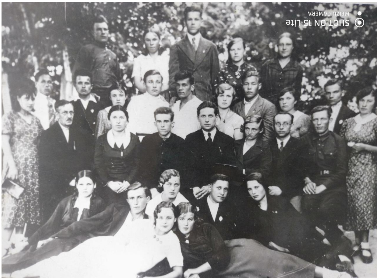
1-й выпуск Томаровской средней школы, 1938 год.

В 1998 году исполнилось 60 лет Первому выпуску Томаровской средней школы.