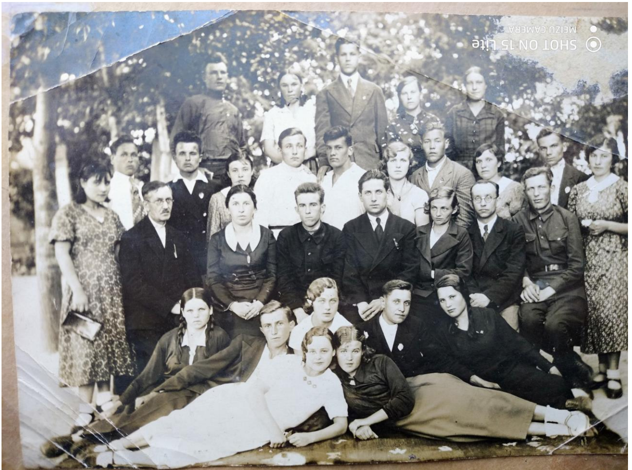
Первый выпуск Томаровской средней школы, 22 июня 1938 года.

Назовем всех участников этого исторического фото слева направо и снизу вверх и известные факты их биографий: