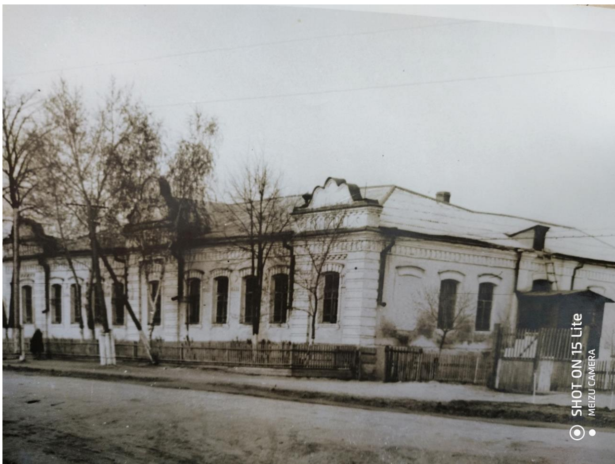
Здание Томаровской средней школы в 1943-1959 годы (бывшее здание Белянской земской начальной школы конца 19 века, в 1938-1939 гг. – Белянской семилетней школы) на улице Белянской (ныне Ленина).

Занятия в Томаровской средней школе начались в сентябре 1943 года в здании Белянской семилетней школы (ныне улица Ленина). В этом же здании некоторое время находился и клуб.