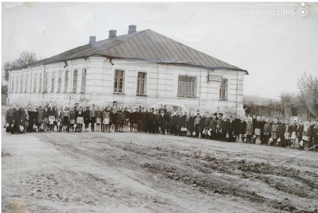
Первомайская начальная школа слободы Томаровки, фото 1960-х гг.

Младшие классы школы стали располагаться в здании Первомайской начальной школы.